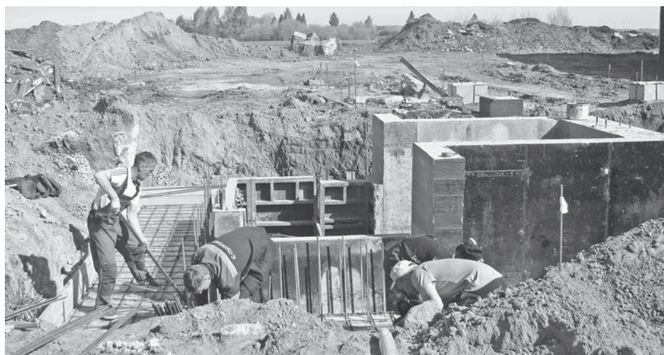
Строится новый зерносушильный комплекс.

По данным Байкаловского отдела с/х на 17 мая.