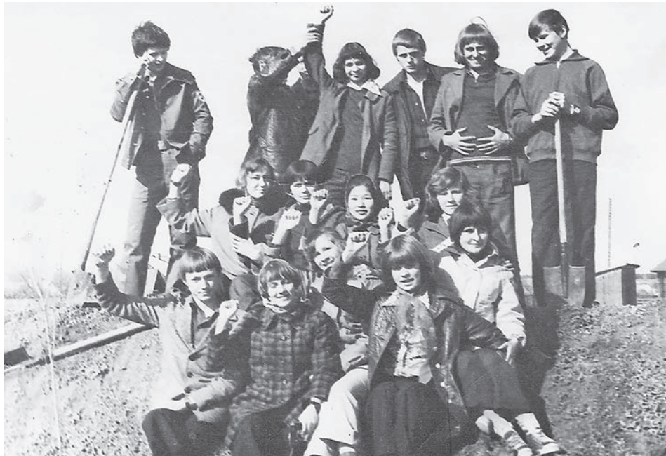
1978 год. 9б класс на субботнике.

В 1969 году зародилась игра «Зарница». Учились по-пластунски ползать, «радисты» учили азбуку Морзе. Санитарочки шили сумки. Для всех юнармейцев это был большой праздник. Во всех школах района к нему готовились зара-