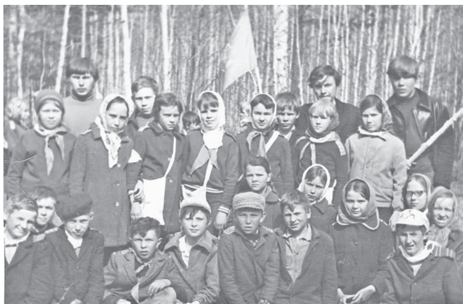
1973 год. 5в класс в лесу на «Зарнице».

Пусть не все мы стали «пламенем», но в актив-