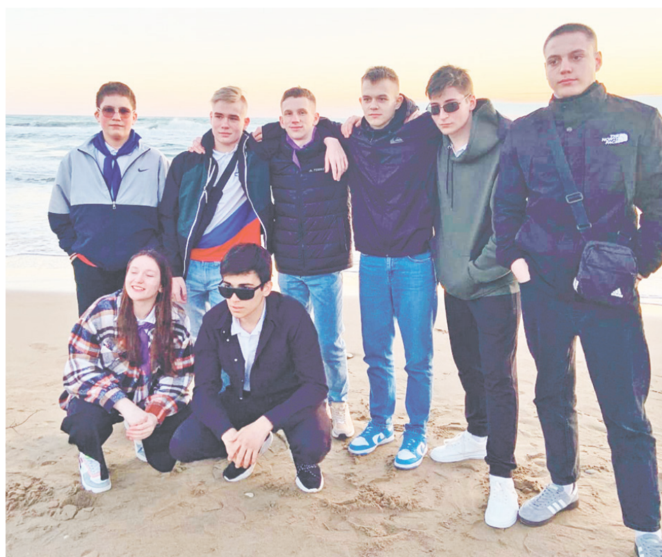
В лагере собрались ребята из разных уголков России.

– Было очень много тематических мероприятий про театр, например, «Школа театрального мастерства». Много рассказывали об истории «Орлёнка», его традициях, легендах. Я узнал, что в лагере были