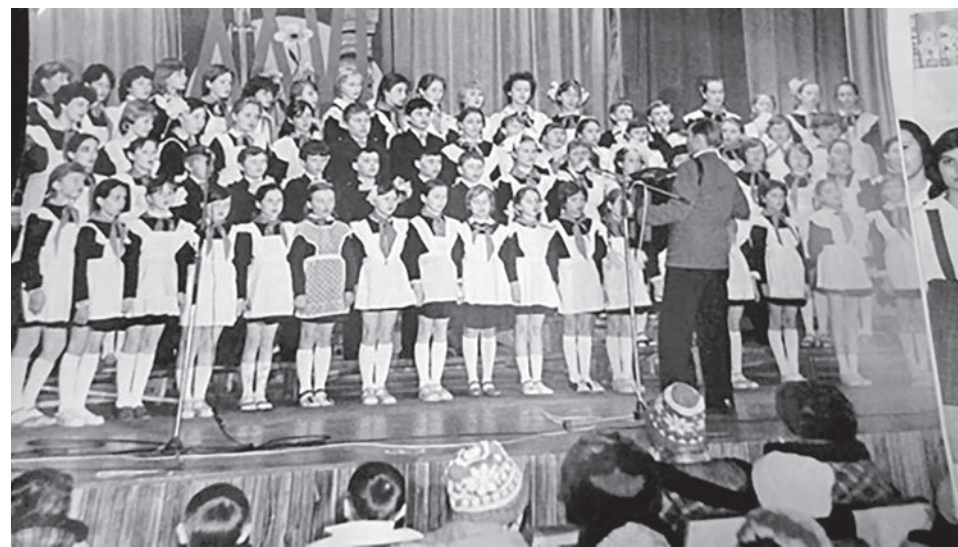
Пионерский хор был украшением всех партийных собраний.

Музыка – «язык чувств». Она волнует, вызывает у ребят определённые настроения и переживания. Полученные впечатления усиливаются под воздействием учителя, который передаёт свои чувства не только в выразительном исполнении произведения, но и в слове, мимике, жестах. Концентрируя внимание учащихся на звучании музыки и развивая воображение, педагог помогает детям войти в мир музыкальных образов, ярко ощутить их выразительность.