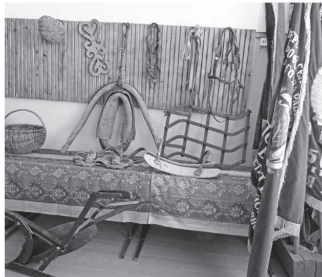
В музее представлены предметы труда и быта.