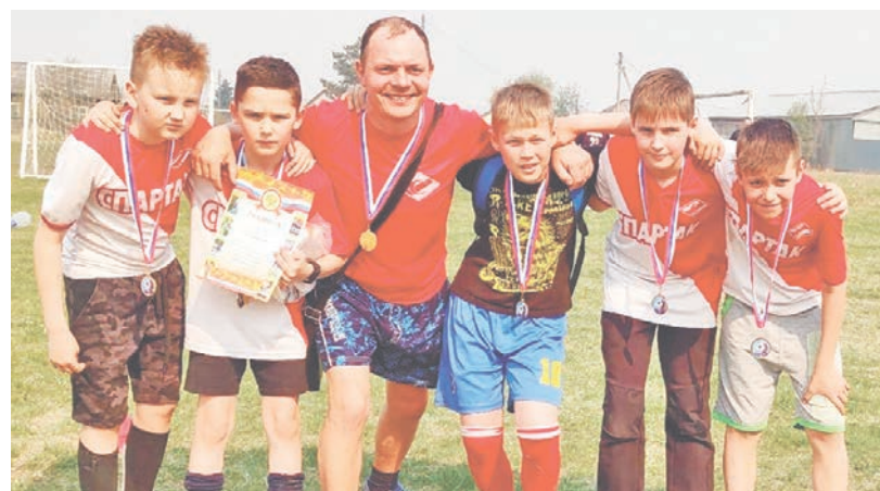
Воспитанники «Спарты» добиваются успехов не только в шашках, но и в футболе.

За победу среди мужчин бились четыре команды. Борьбы в этой группе было много, выиграла молодая и дерзкая «Спарта». Один из лидеров байкаловского футбола последнего времени «Баит» довольствовался вторым местом. Футбольный клуб «Шанхай» – третий. Гости из Туринской Слободы – четвёртые.