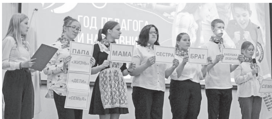
Активисты показали яркие выступления.

Ребятам на мероприятии было интересно и познавательно, они с пользой провели время и готовы дальше участвовать в проекте. Все в восторге от условий и оснащённости Байкаловской школы, с удовольствием смотрели на опыты и эксперименты, мечтают, чтобы в школах района тоже появились такие возможности.