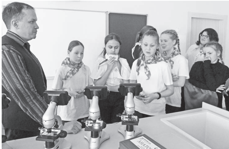
Ребятам предстояло пройти квест.